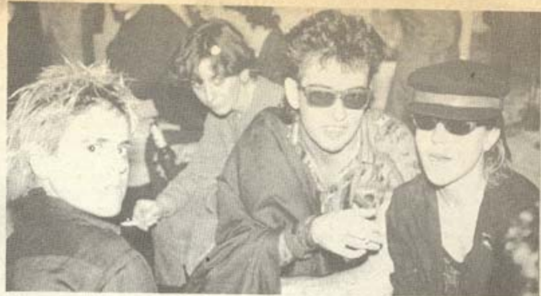
La gente de Neo Ama de Kass por La Mode